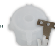
КП-229 с крюком D 90 мм, h 61 мм