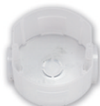
K-207 D 75 мм, h 40 мм