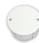
KM-216 D 88 мм, h 52 мм