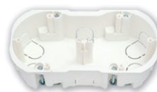
K-219 Коробка двухместная 155x76x45,5 мм