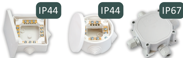
КМ-222 Размер коробки: 80x40x43,5 мм Габаритный размер: 102x102x43,5 мм КМ-223 Размер коробки: D 74 h 43,5 мм Габаритный размер: D 87 h 43,5 мм КМ-230 Размер коробки: D 75,7 h 44,5 мм Габаритный размер: D 130 h 43,5 мм

Для разводки проводов с использованием контактных зажимов