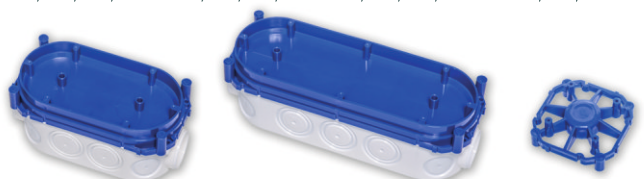
К-420 153,5x82,5x71,5 мм К-430 224,5x82,5x71,5 мм ЮЛИГ.735356.104 Опора 82,5x82,5x28 мм