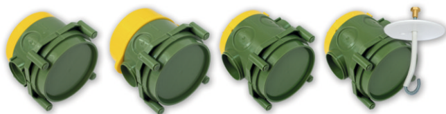
К-401 82x80x72,5 мм К-403 82x80x79,5 мм К-404 82x80x91,5 мм КП-402 с крюком 82x80x90,5 мм

МОНТАЖ НА СПЛОШНЫЕ СТЕНЫ ИЗ НЕГОРАЕМЫХ МАТЕРИАЛОВ