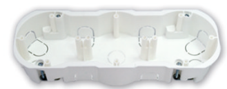
K-220 Коробка трехместная 226x76x45,5 мм