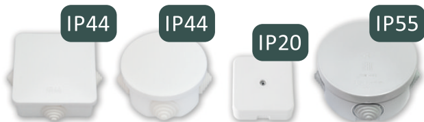
КМ-209 Размер коробки: 76x76x41,5 мм Габаритный размер: 86x86x41,5 мм КМ-208 Размер коробки: D 66 h 41,5 мм Габаритный размер: D 85 h 41,5 мм КМ-239 60x60x41,5 мм КМ-233 Размер коробки: D 85 h 50,3 мм Габаритный размер: D 105 h 50,3 мм