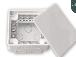
KM-212 95x95x53 мм

Для разводки проводов с использованием контактных зажимов