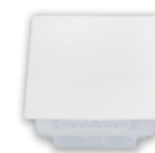
KM-202 95x95x53 мм