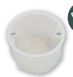
K-215 D 70 мм, h 41,5 мм