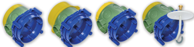
К-411 82,5x82,5x72,5 мм К-413 82,5x82,5x79,8 мм К-414 82,5x82,5x91,5 мм КП-412 с крюком 82x82,5x89,5 мм