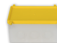
KM-405 172,5x127x90 мм