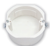
K-205 D 76 мм, h 40 мм