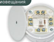
KM-225 D 74 мм, h 41,5 мм

Возможность подсоединения абонентской линии радиовещания