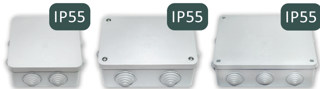
КМ-234 Размер коробки: 100x100x55,3 мм Габаритный размер: 126x126x55,3 мм КМ-235 Размер коробки: 120x80x58,3 мм Габаритный размер: 146x106x58,3 мм КМ-236 Размер коробки: 160x120x58,3 мм Габаритный размер: 186x146x58,3 мм

Для разводки проводов с использованием контактных зажимов