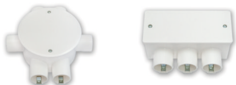
КМ-217 140x140x53,5 мм КМ-218 124x77x54,5 мм

МОНТАЖ НА СПЛОШНЫЕ СТЕНЫ ИЗ НЕГОРАЕМЫХ МАТЕРИАЛОВ