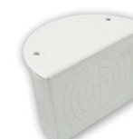
KM-213 140x81x92 мм