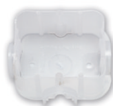
K-201 85x75x40 мм