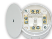
KM-227 D 74 мм, h 41,5 мм