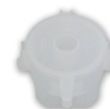
КП-204 D 90 мм, h 61 мм