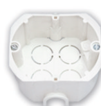
K-210 76x75x40 мм