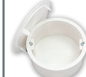
KM-206 D 94 мм, h 46 мм

Для разводки проводов с использованием контактных зажимов